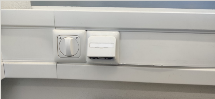
Anschluss im Pool 1 (Hamming)