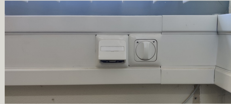
Anschluss im Pool 2 (Zuse)

In Pool 1&2 befinden sich die Anschlüsse für den jeweiligen Beamer im Brüstungs-Kanal unter dem Fenster. Zum anschließen wird ein eigenes VGA Kabel benötigt.