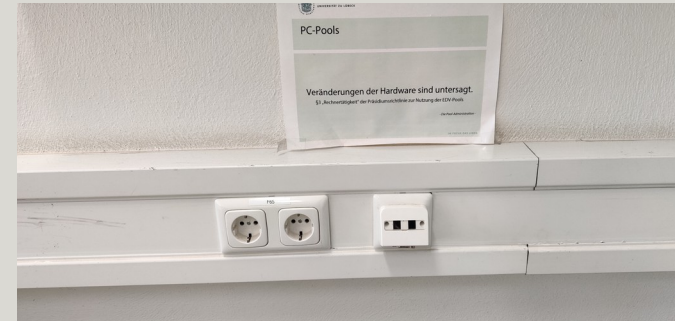
Anschluss im Pool 3 (Amdahl) Anschluss im Pool 4 (Wirth)

Im Pool 3 liegt ein VGA Kabel, an das direkt ein eigenes Notebook angeschlossen werden. Im Pool 4 befindet sich der VGA anschluss in dem Brüstungs-Kanal an der Wand. Hierfür wird ein eigenes VGA Kabel benötigt.